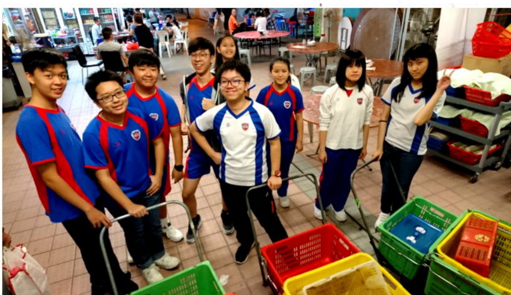
學生由小四開始參與社區服務，圖為中學生到街市搜集菜再送贈到基層。

「這便是學校雙語環境成功的地方。我記得大仔小五要讀原著《誰搬走了我的乳酪》，要查很多字，他共用了大半年才適應到全英語學習，堂上參與討論，對於內向的他也不容易；但學校的高度包容性和語文方向，提升到他的自信。」她續稱，細仔較哥哥活潑很多，學校有大量活動讓他嘗試，他現時參加了冰球及小提琴。「學校功課程度有挑戰性，孩子也要很努力，但校方不鼓勵家長插手。」她謂學校理念很創新，但見到兒子健康愉快成長。「他們很喜歡學校，也對學習有熱誠！」