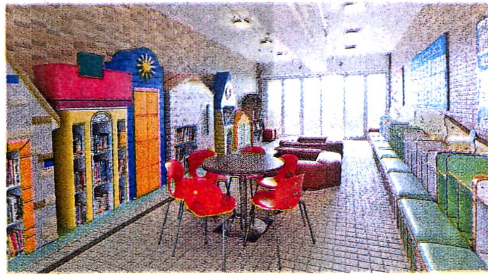
小學各層設有圖書角。